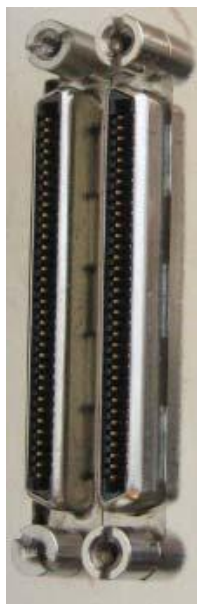
68-Pin IO Connector Pin Assignment